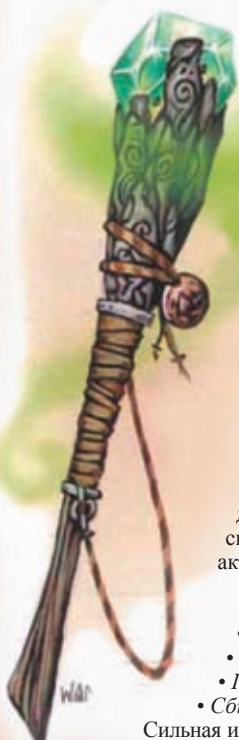
посох лесной местности